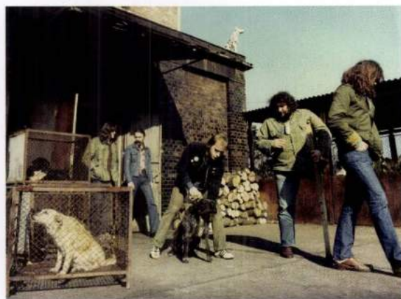
Jelenetkép a Kopaszkutya című filmből