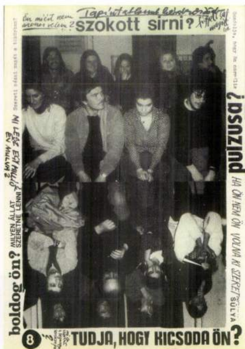
A HURKA Színpad egyik hirdetőménye