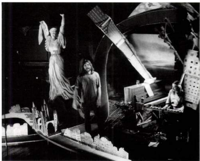
I love you Budapest , Radnóti Színház, 1994, r: Valló Péter, dizlet: Rajk László