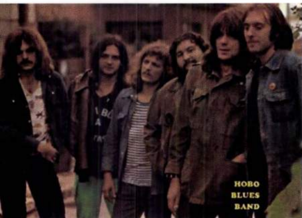
A Hobo Blues Bandet népszerűsítő poszter

H: Persze, írtam is, „rendeztem” is néha. De én most magáról a színészetéről beszélek. Amikor jobban megismertem ezeket a nagy dolgokat, a Rolling Stonest, a Doorst, Bob Dylant, Jimi Hendrixet, úgy gondoltam, hogy a rock forradalmi művészet, és ugyanolyan jogai, esetleg még kötelességei is vannak a világ ábrázolására, mint az összes többi művészetnek. Hogy nem a rockzenét kéne bevinni a színházba, hanem a színházat kéne kihozni a rockzenébe. Például a Képzelt riport egy amerikai popfesztiválról 2 , ezt a hazugságot a rockfesztiválok fasizmusáról, baromi-