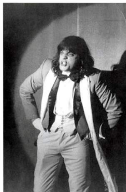
Hasfelmetsző Jackként Wedekind: Lulujában , Miskolci Nemzeti Színház, 1983, r: Csizsár Imre

H: Nem is nagyon ment. De ennek volt egy előzménye. Az első igazi színházi szereplésem 1981-ben a miskolci Nemzeti Színházban volt az ... és te, szépségem, igen-igen, te... Cukorváros című darabban, amit